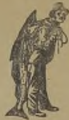
Nenhuma é legitima sem esta marca.

(de Puro Oleo de Fígado de Bacalháo com Hypophosphitos).